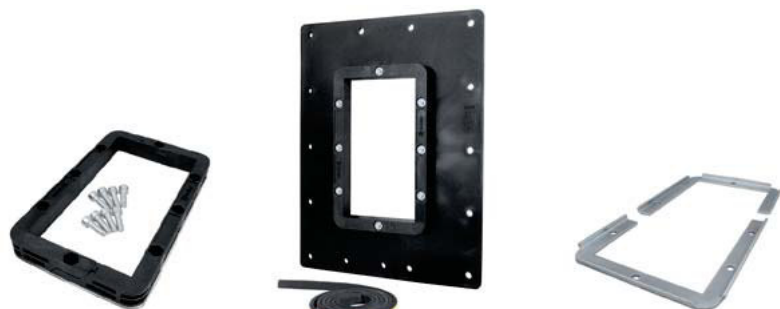
C KFO 6x1

Marco C KFO, PA 6.6, 30% de fibra de vidrio - ala, PP | Cadre C KFO, PA 6.6, 30 % fibre de verre - bride, PP